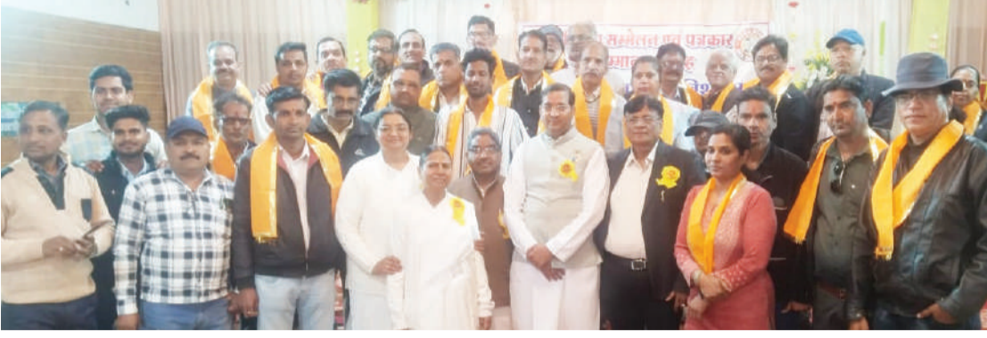
रावतभाटा में मीडिया सेमीनार एवं सम्मान समारोह आयोजित