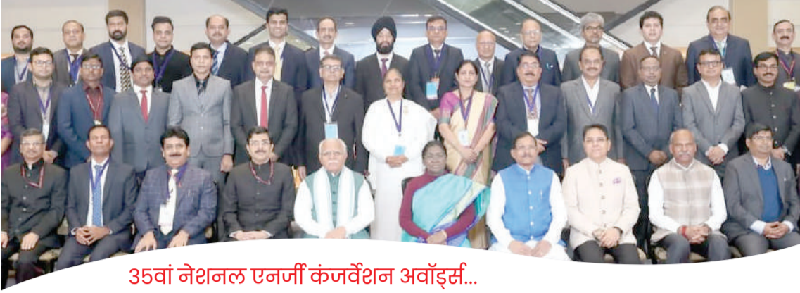
35वां नेशनल एनर्जी कंजर्वेशन अवॉर्ड्स...