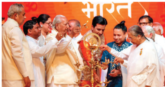
शांतिवन में आयोजित स्वर्णिम स्वर्ण भारत कार्यक्रम का उद्घाटन करते हुए कवि कुमार विश्वास, गायक कैलाश खेर व अन्य।

आजादी के अमृत महोत्सव से स्वर्णिम भारत की ओर अभियान का देशभर में महा उत्सव