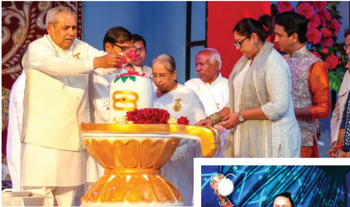
कार्यक्रम का उद्घाटन करते अतिथि। प्रस्तुति देते कलाकार।

» शिव आमंत्रण, आबू रोड। स्वर्गों ने जब संगीत की धुन पर शिवमय तान छोड़ी तो आध्यात्म की महफिल सज उठी। सूरों की संध्या में शब्द कंठ से बाहर निकलते तो संगीत की जुगलबंदी से स्वर्ण रूप ले लेते। ऊं ध्वन और तालियों की गड़गड़ाहट से हॉल परमात्मा शिव की महिमा में गुंज उठा। मौका था ब्रह्माकुमारीज के मुख्यालय आबू रोड स्थित शांतिवन में महाशिवरात्रि पर स्वर संध्या का। देश के जाने-माने कवि डॉक्टर कुमार विश्वास और पद्मश्री गायक कैलाश खेर ने स्वर्गों का ऐसा रंग जमाया कि वह थिरकने लगे। परमात्मा शिव के अवतरण की 86वीं शिवजयंती का दिन संस्थान के लिए ऐतिहासिक रहा। रियलिटी शो स्वर्ण स्वर भारत की पूरी टीम शांतिवन पहुंची। कार्यक्रम में पूरे समय परमात्मा की महिमा के गीत गुंजते रहे। कार्यक्रम की शुरुआत में संस्था के वरिष्ठ बीके भाई-बहनों ने शिवलिंग पर पुष्प अर्पित किए। अपनी कविताओं से सबका दिल जीतने वाले डॉक्टर कुमार विश्वास ने संस्था की प्रशंसा करते हुए कहा कि मैंने अब तक हजारों